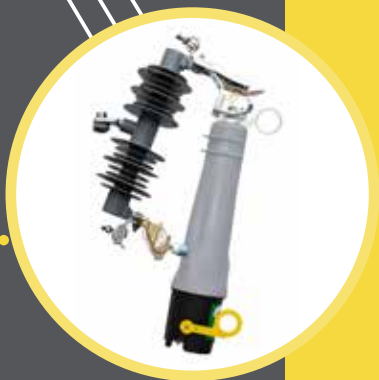
Interruptor com Rearme Automático VacuFuse® II